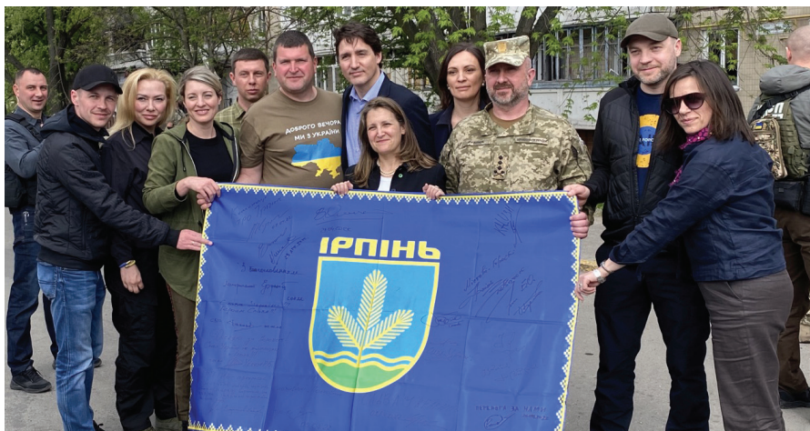
Джастін Трюдо – Прем'єр-міністр Канади