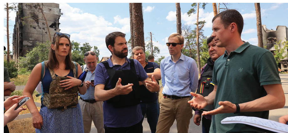
Делегація Комітету з юридичних питань і прав людини Парламентської асамблеї Ради Європи