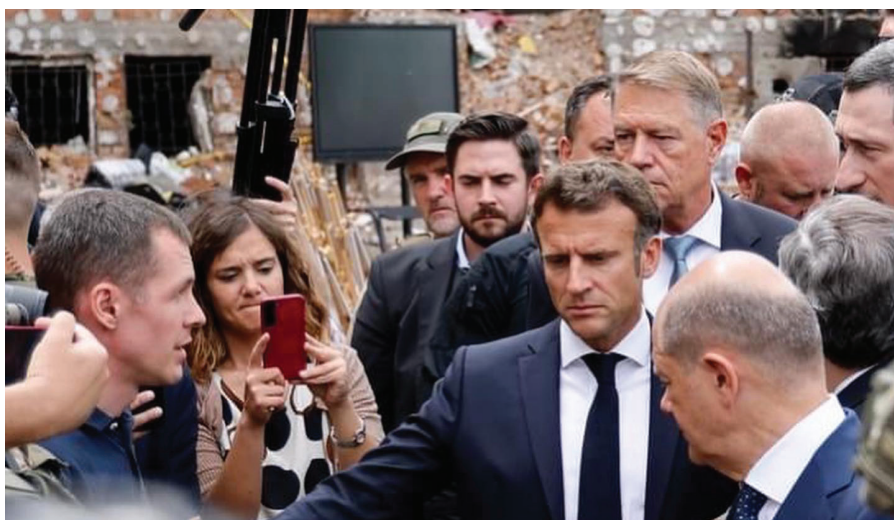
Еммануель Макрон – Президент Франції, Олаф Шольц – Федеральний канцлер Німеччини, Маріо Драгі – Прем'єр-міністр Італії та Клаус Йоханніс – Президент Румунії.