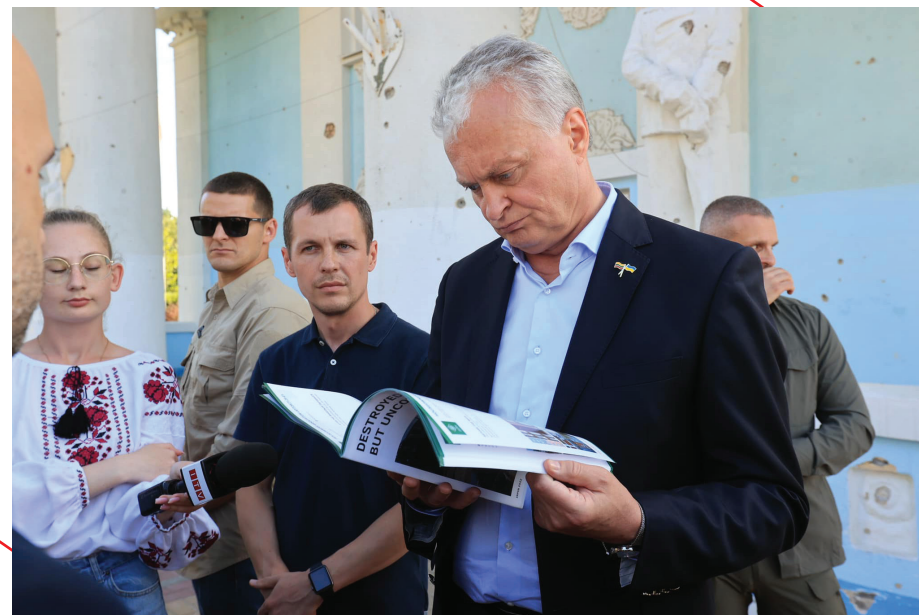
Гітанас Науседа – Президент Литви